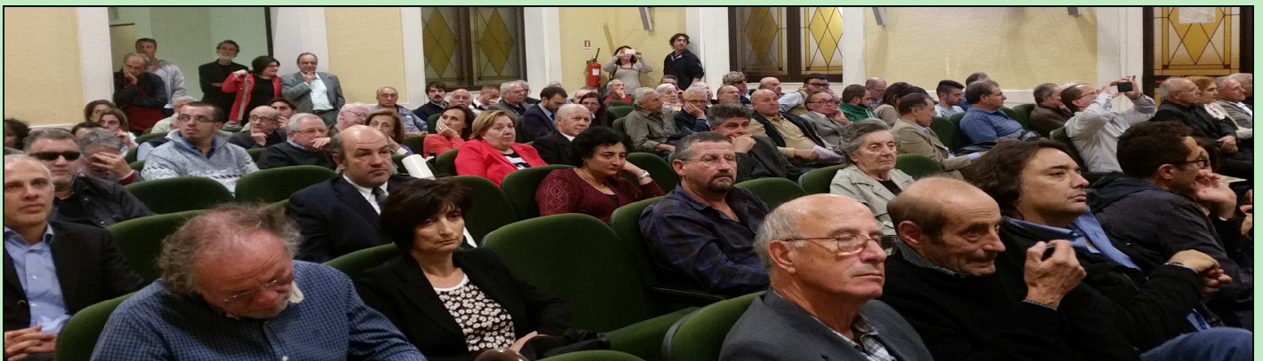
(Sopra, un'immagine del pubblico presente all'affollato convegno)