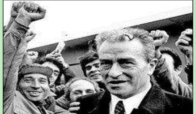
(sopra e a destra, immagini di Pietro Ingrao)

Pietro Ingrao: il comunista che "voleva la luna", un mondo di liberi ed uguali, ha aspettato l'eclisse lunare per andarsene da questo mondo, lasciandoci un patrimonio di idee, di analisi della società, di proposte per lo sviluppo del Paese, per la crescita della democrazia, per l'efficienza delle Istituzioni di inestimabile valore. Ingrao ha avuto un legame specie con la Calabria, un rapporto unico. Sono tre i momenti della nostra storia regionale che hanno dato origine e segnato il suo rapporto con la Calabria e con il PCI calabrese. E' lui stesso ad affermarlo nel suo libro "Volevo la Luna" nel quale afferma che "Amavo la Calabria quasi quanto il mio Paese natio". Questo amore non può che essere nato dal legame stabilitosi nel 1943, quando per la prima volta viene nella nostra Regione ed inizia un lungo percorso cadenzato da tre fasi: